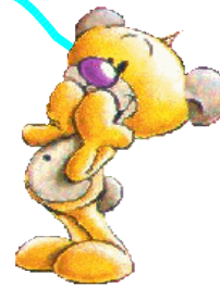
tafel van 5