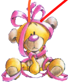
tafel van 3